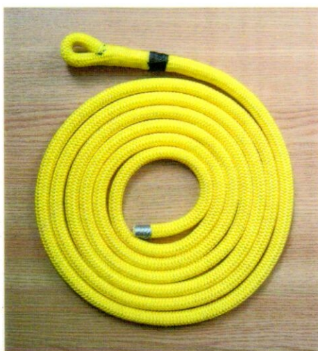
„Tendon Timber Evo 11,5 mm se zapleteným okem / Tendon Timber Evo 11,5 mm with spliced eye“

Kopírování částí tohoto dokumentu je povoleno se souhlasem VVUÚ, a.s., NB 1019, v Ostravě – Radvanicích.